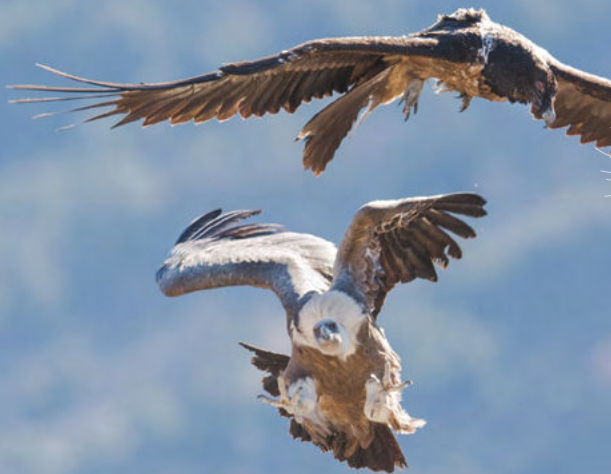
GYPAÈTE BARBU ET VAUTOUR FAUVE